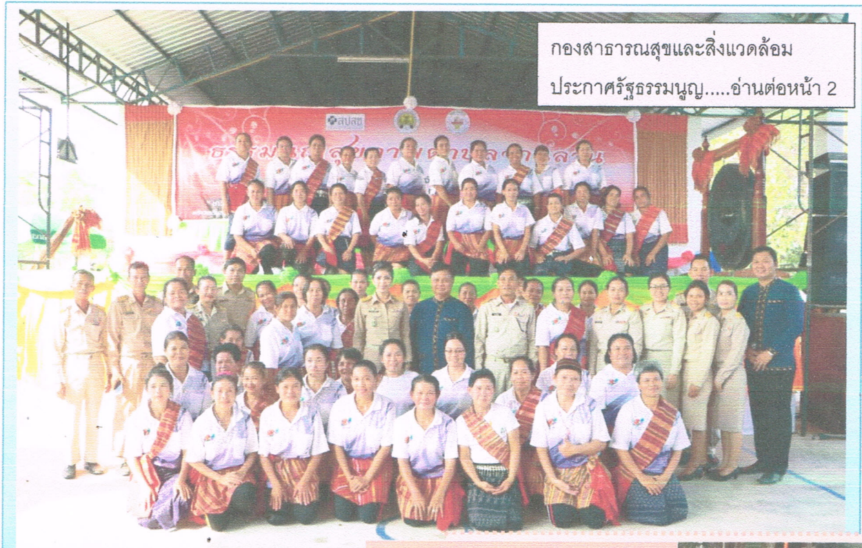
กองสาธารณสุขและสิ่งแวดล้อม ประกาศรัฐธรรมนูญ.....อ่านต่อหน้า 2

จดหมายข่าวองค์การบริหารส่วนตำบลจานลาน อำเภอพนา จังหวัดอำนาจเจริญ ประจำเดือน เมษายน 2561 เว็บไซต์ www.janlan-acr.go.th