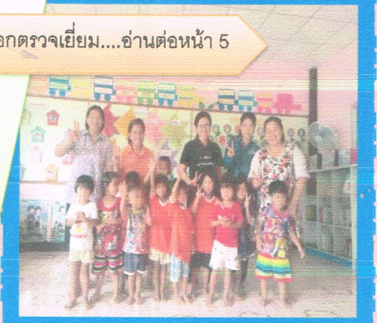
ด้วยกระทรวง การพัฒนาสังคมฯ ดำเนินโครงการ .....อ่านต่อหน้า 6