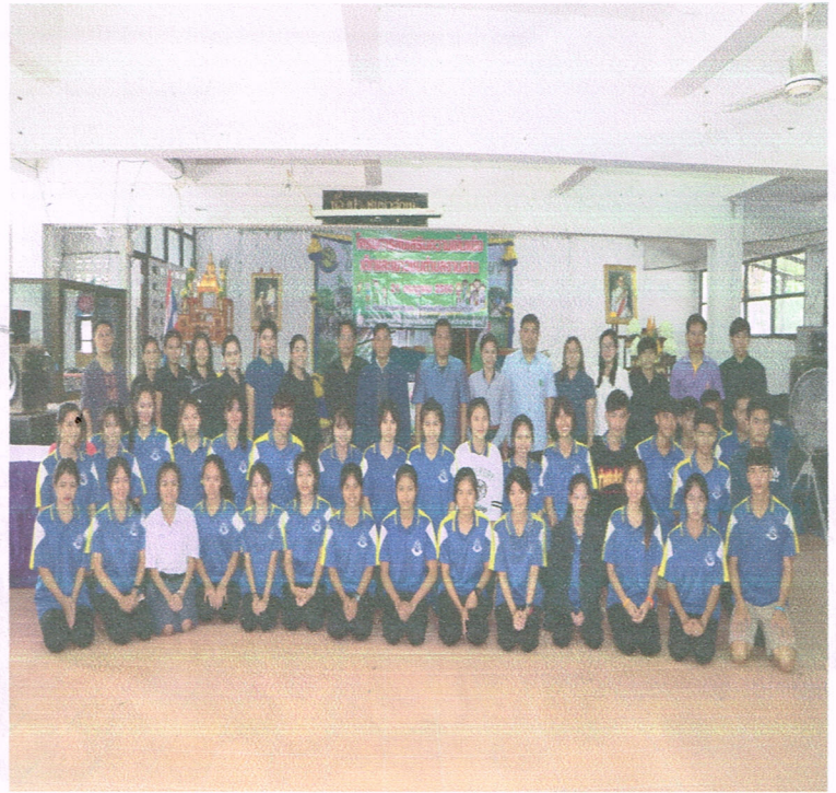
โครงการอบรมเยาวชนในการป้องกันและการแก้ไขปัญหาเสพติดในวัยรุ่นโดยงานพัฒนาชุมชน สำนักปลัด