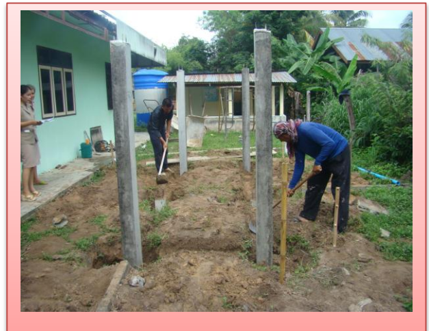
งานโครงสร้างและออกแบบ โครงการก่อสร้างถนนคอนกรีตเสริมเหล็กภายในหมู่บ้าน