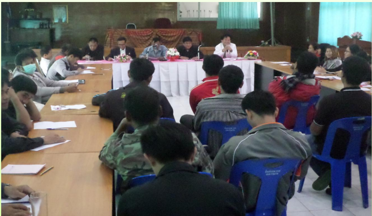
งานบริหารงานทั่วไป

ประชุมพนักงานประจำทุกเดือน ในสัปดาห์แรกของเดือน